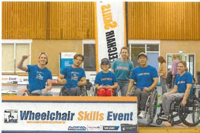
Wheelchair Skills Event Berlijn